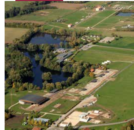
Parc archéologique européen de Bliesbruck-Reinheim