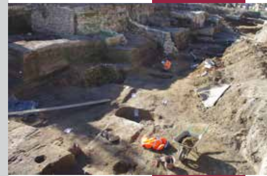
Fouille : Metz - rue Paille Maille - 2012