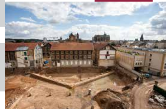
Fouille : Metz - Ancienne Manufacture des Tabacs - 2013

photo de couverture - fouille de la ZAC du Parc du Technopole, site D.